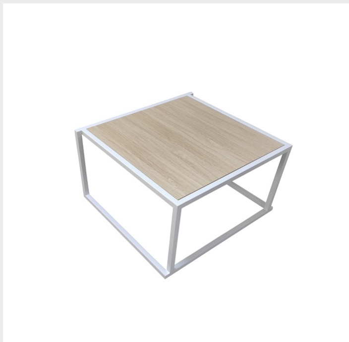
TABLE BASSE STAKO